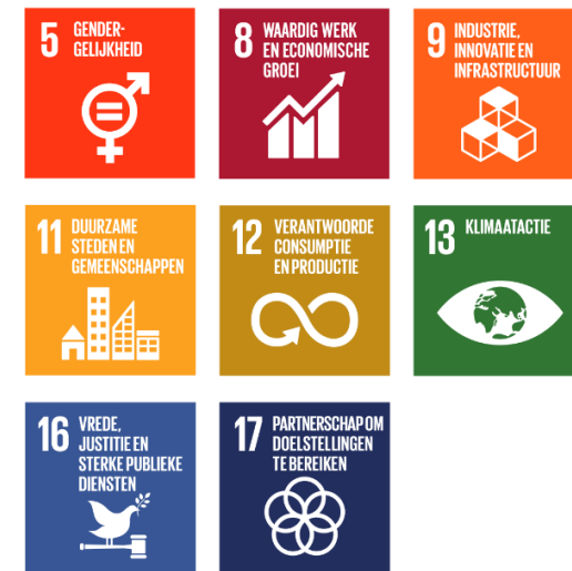
Figuur 1-1 SDG Nederland. (ca. 2020, July). Verhouding ESG en 17 duurzame ontwikkelingsdoelstellingen (SDG's) van de Verenigde Naties. https://www.sdgnerland.nl/communicatiemateriaal/ .

Gericht op bedrijfsethiek, naleving wet- en regelgeving (compliance), onafhankelijkheid bestuur, eerlijke concurrentie en beloning.